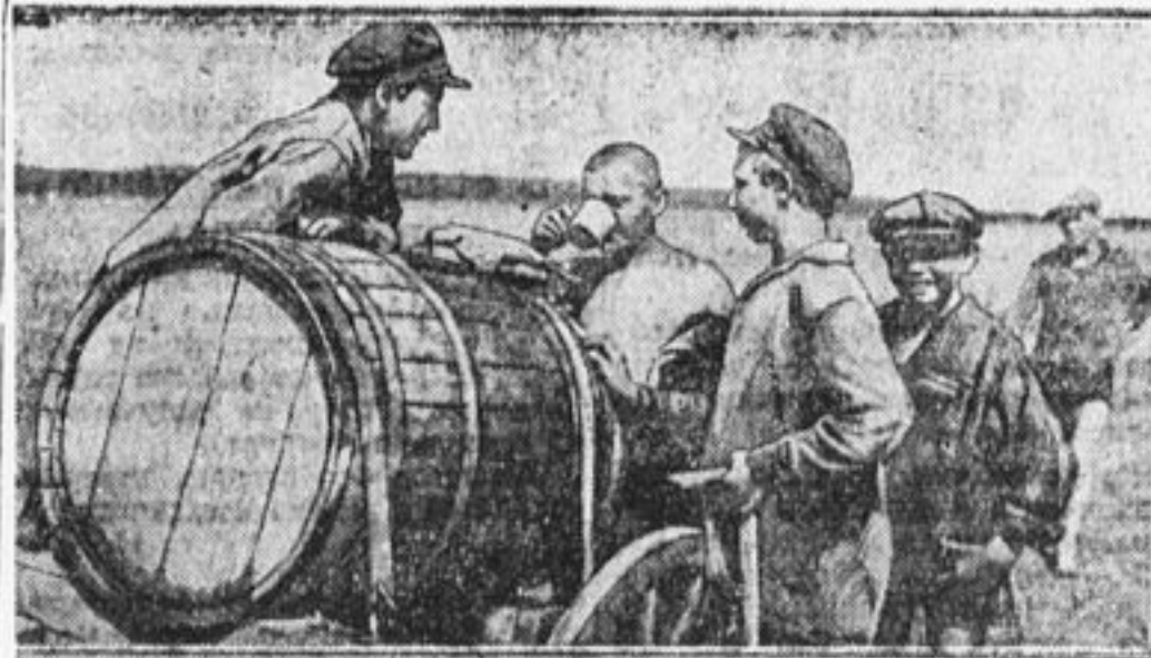
На уборке урожая в коммуне им. Горького, Харьк. окр.

На Всесоюзном слете будет работать специальная конференция ребят-колхозников. Готовьте материал для предложений.