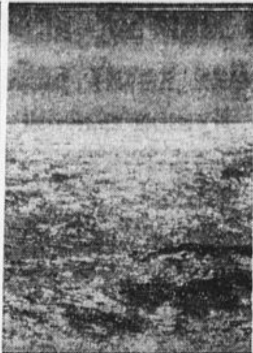
Полуночное солнце у о. Беринга.

Он был очень недоволен законом, который на 10 лет запретил добычу этого ценного зверя, и дрожал, как в лихорадке, от охватившего его охотничьего азарта