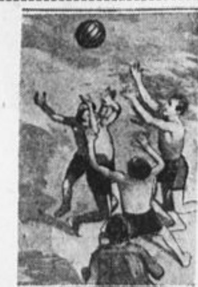
Тренировка к спартакиаде.

«Прежде всего необходимо из- дать материалы слета для того, чтобы все могли подробно узнать о работе и постановлениях слета. В предполагаемом музее пио- нерских работ нужно организо- вать комнату, где систематически отмечать, что сделано по мате- риалам слета. Хорошо бы сейчас принять постановление о созыве ежегодных райслетов и пятилет- ние всесоюзные слеты, где про- верять и исправлять ход всей ра- боты организации».