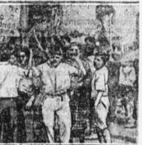
Демонстрация американских пионеров около парохода с уезжающими на свой всемирный слет скаутами.

За участие в демонстрации против бойскаутов был арестован