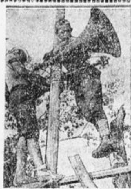
Установка радиорупоров на месте открытия слета.

Иногда в ответ следовали не приятные, но правдивые слова. Вот что сказал ирисник Пети Коны: