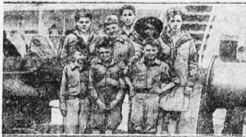
Американская делегация на пароходе перед отъездом из Нью-Йорка.

даваемые крупнейшими капиталистами, и направлена на борьбу с пролетариатом. В ответ на эти слова скауты громко рассмеялись. Тогда оратор предложил самоуверенным скаутам ответить не смехом, а вразумительно и доказать собравшимся, что он не прав.