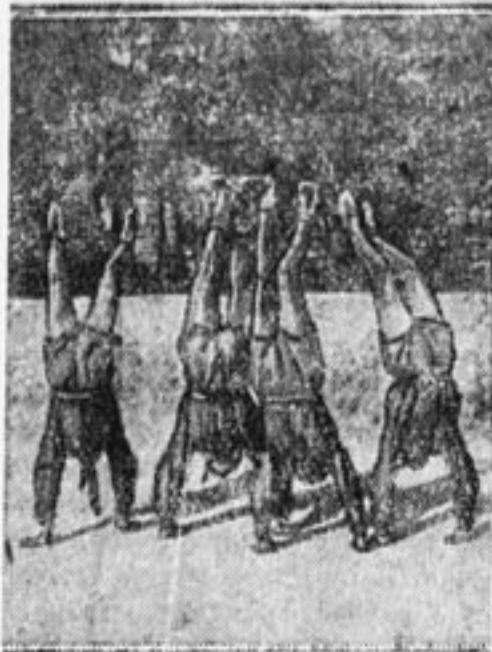
Физкультура без конца.

Начался закавказский слет, но никто из руководителей этого слета не знает, как прошли слеты на местах, какие промахи и ошибки были сделаны.