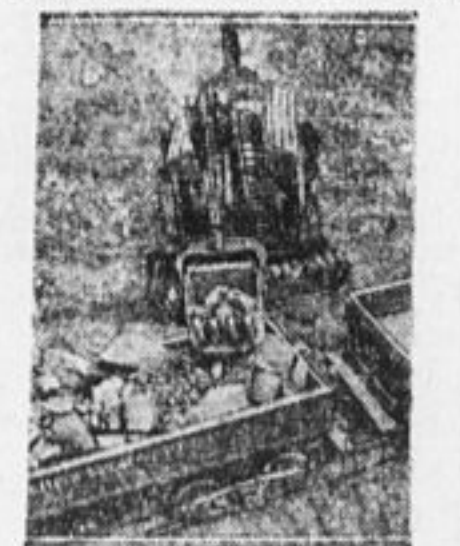
Паровой экскаватор на Днепропрое грузит платформы кусками разбитой взрывом скалы.