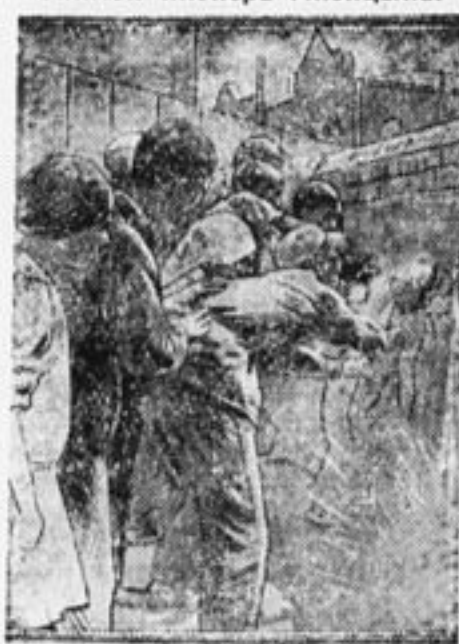
У кранов свалка.