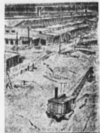
На постройке «Сельмашстроу» в Ростове-на-Дону.

Вот главные уроки из опыта организации первого лагеря-школы.