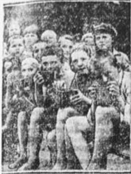
Фотокружок пионерлагеря «Чехолдино» с самодельными фотоаппаратами.

▲ пятилетки борьбы с эксплуатацией детского труда; ▲ сделать детский до 14 лет учебно-производственным; ▲ создать сеть школ с круглым годом обучения; ▲ в каждом крупном колхозе — пионеротряд