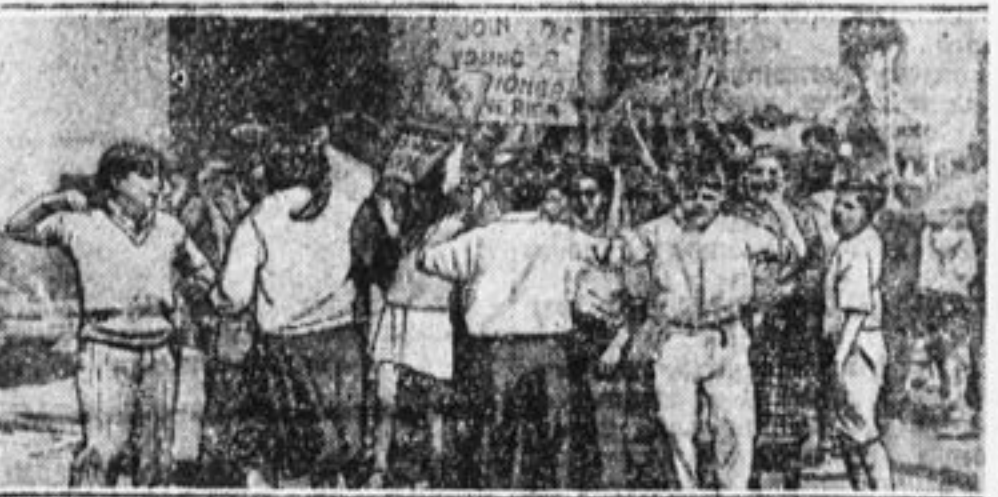
Демонстрация американских пионеров около парохода с уезжающими на свой всемирный слет скаутами.

Лишь один из скаутов проявил признаки жизни. Он купил демонстративно номер «Юнг Уоркера» и тут с большой торжественностью, на глазах у всех, изорвал его. «Вот наш ответ», — крик-