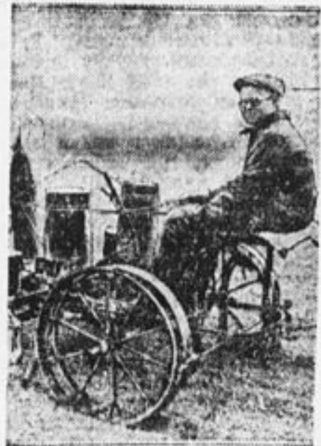
На новой машине.