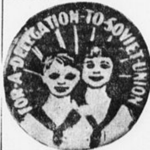
Значок, продаваемый в Америке пионерами. На нем написано: «Для делегации в Советский Союз».

Во многих пунктах проведены специальные антискаутские рабочие конференции, намечавшие кандидатов в делегаты. Такие конференции состоялись в самом Биркенхеде и Поркшайре, в отдельных пунктах Ю. Уэльса, Лондоне и т. д. В английскую делегацию входят мальчики и девочки от детских секций при кооперативном движении (большая рабочая организация), от социалистических воскресных школ и от «лиги юных товарищей» (пионеров).