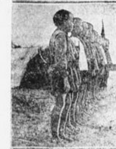
Пионеры-чуваши в лагере.