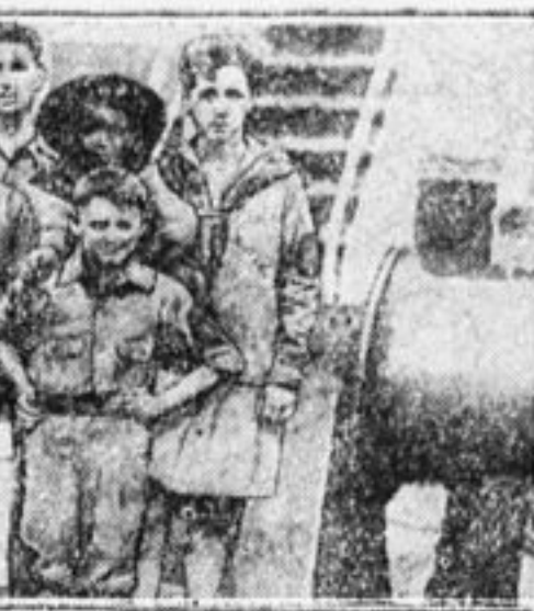
Американская делегация на пароходе перед отъездом из Нью-Йорка.

тов. «П. П.» уже писала о том, какую демонстрацию против отъезда скаутской делегации на «джамбори» устроили американские пионеры. Теперь мы помещаем фотографию этой демонстрации. В отместку за эту демонстрацию на-днях политическая