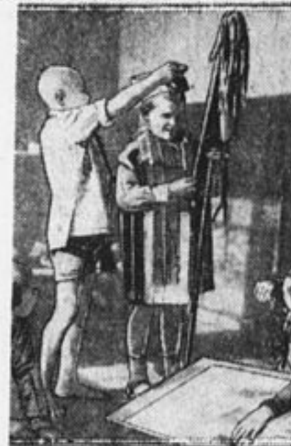
В Парке культуры и отдыха гото- вятся к карнавалу.

* В районных садах и на ра- бочих собраниях Москвы высту- пают тройки по агитации за слет из гармониста, рассказчика и раешника.